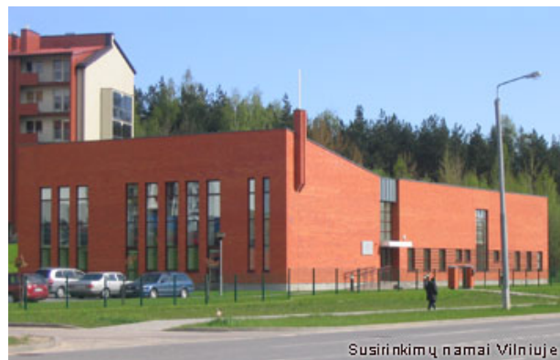
Paveikslas 2: Pastarųjų dienų šventųjų susirinkimų namai Vilniuje

Pastarųjų dienų šventųjų Jėzaus Kristaus bažnyčios nariai sekmadieniais į pamaldas renkasi Vilniaus, Kauno, Klaipėdos ir Šiaulių susirinkimų namuose. Prie bendruomenių veikia sekmadieninės mokyklos vaikams bei suaugusiems. Kaip ir visame pasaulyje, Lietuvoje mormonai aktyviai veikia labdaros srityje, remia įvairias vaikų globos organizacijas, organizuoja nemokamas anglų kalbos pamokas pageidaujantiems.