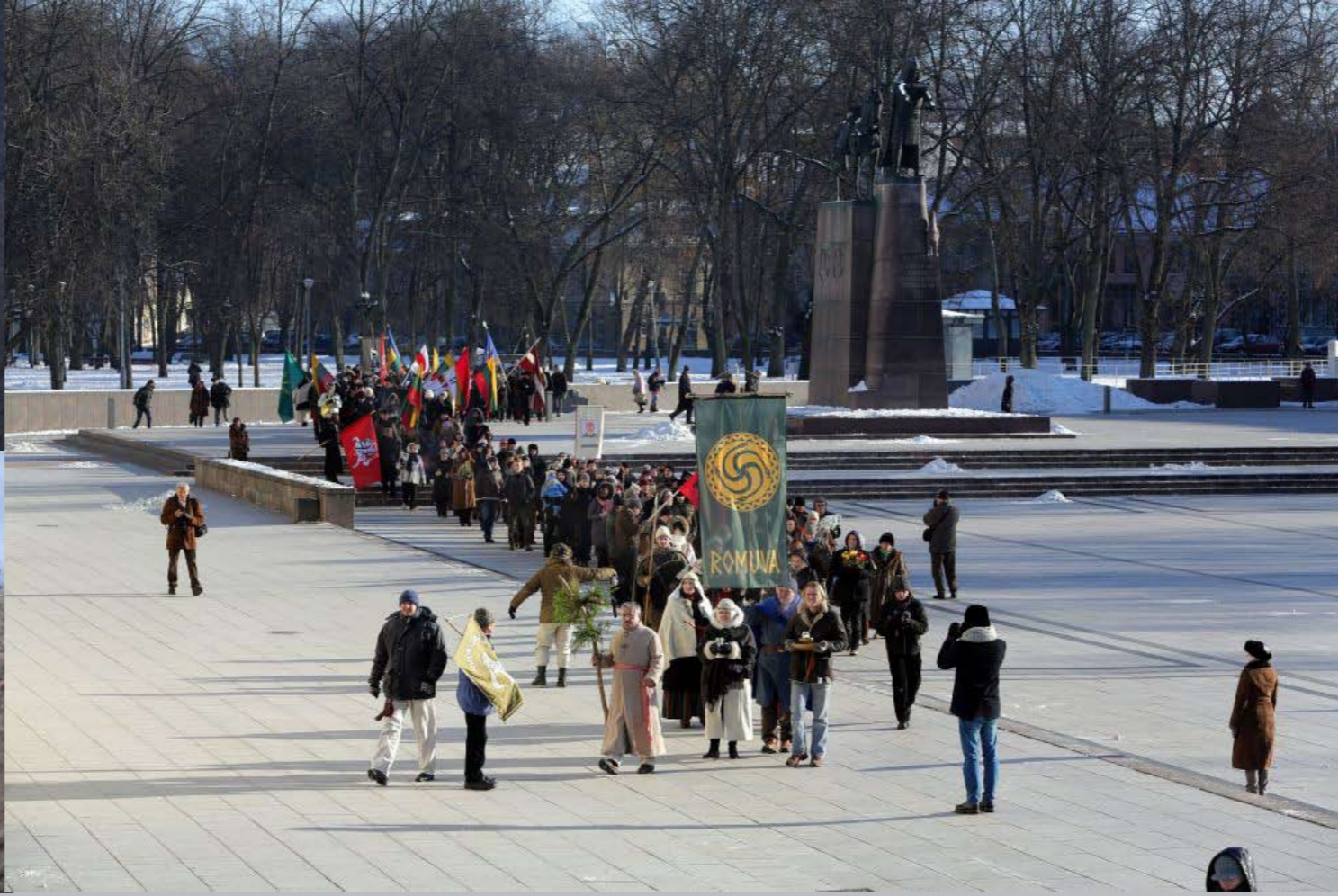
RELIGINĖ ĮVAIROVĖ LIETUVOS ŽINIASKLAIDOJE